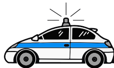
Voiture de police