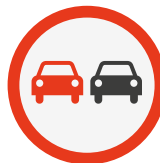
Interdiction de doubler