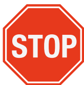
Arrêt à l'intersection